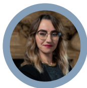
Avv. Elisabetta Sgattoni Zunarelli Studio Legale Ass.

Gestire il lavoro nella Composizione Negoziata